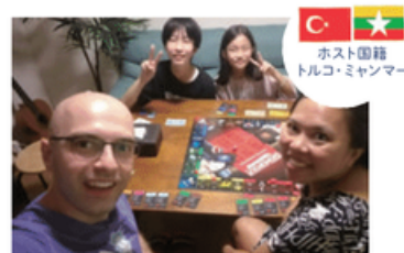
ホスト国籍 トルコ・ミャンマー