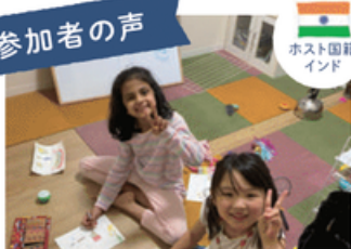
ホスト国籍 インド