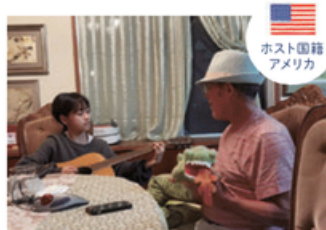
ホスト国籍 アメリカ