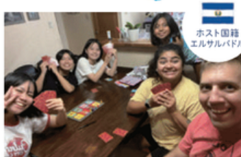
ホスト国籍 ブルガリア