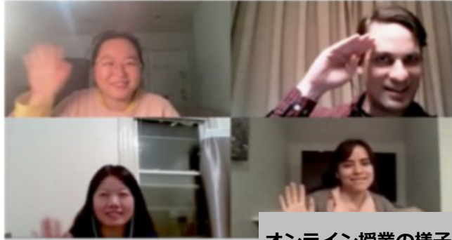
オンライン授業の様子