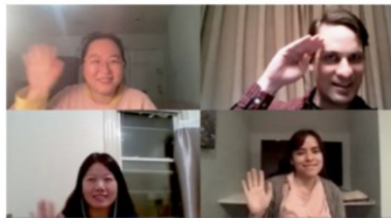
オンライン授業の様子