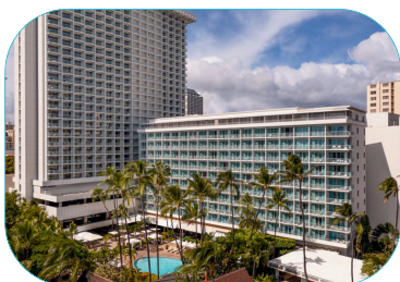
シェラトン・プリンセス・カイウラニ

シェラトン・プリンセス・カイウラニは、ワイキキ中心のカラカウア大通りに面したスーペリアクラスのホテルです。