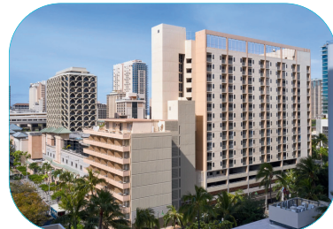
ワイキキ・マリア 〈写真はすべてイメージ〉

ワイキキ・マリアは、ワイキキ中心にありカラカウア大通りからも徒歩圏内のスタンダードクラスのホテルです。