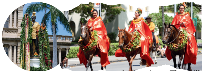
カメハメハ・デーの様子

流鏑馬の行事は、日米間のみならず、世界の恒久平和、天下泰平を祈念する行事となるべく重要な役割を担っております。この文化交流事業に、一人でも多くの方々にご賛同、ご理解を賜り、ご参加いただき、国際社会の平和と繁栄にお力添えくださいますようお願い申し上げます。