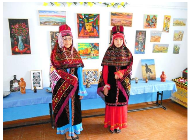
カラクルパクの民族衣装を着た女の子