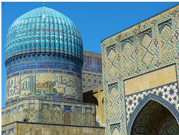
レギスタン広場(サマルカンド・世界遺産)

★帰国後、講評会【6/20(木)14時～】、写真展(7/3～7/31)を開催します。(別途会費)