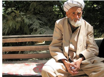
ウズベキスタンの老人