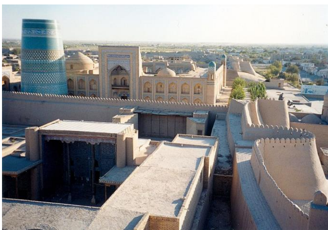
イチャン・カラ(ヒヴァ)世界遺産