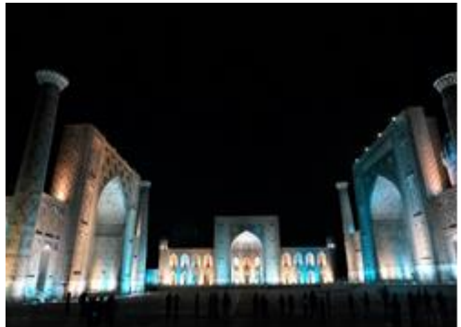
レギスタン広場のライトアップ(イメージ)