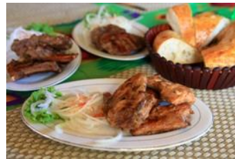
主食はナンとお肉

シルクロードの要衝に栄えたことから、中華風、ロシア風、アラビア風といった東西の味が楽しめます。主食はナン(パン)とお肉、スープやサラダといった前菜、メイン料理には日本人の口にも合った料理が並びます。また水餃子や蒸し饅頭のようなものも出てきます。