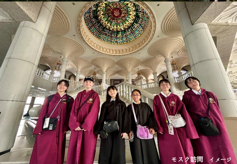
モスク訪問 イメージ