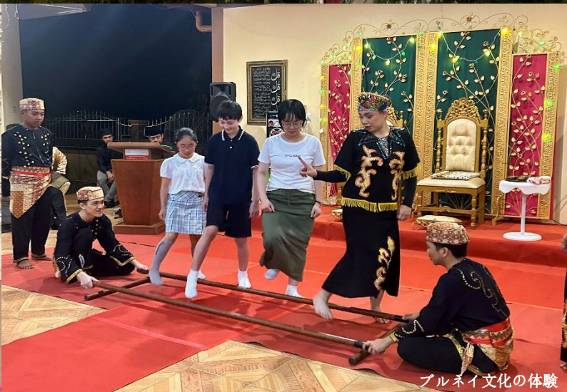
ブルネイ文化の体験