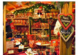
オリンピック聖火台 クリスマスマーケット