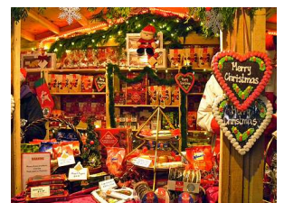
オリンピック聖火台 クリスマスマーケット