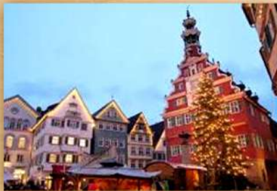
クリスマスマーケット(イメージ)