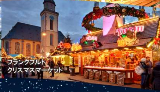
フランクフルト クリスマスマーケット