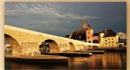
オールド・ストーン・ブリッジ