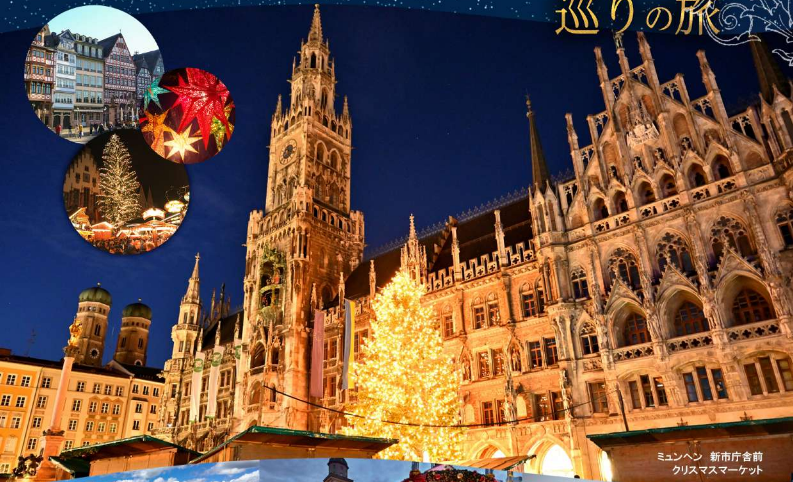
ミュンヘン 新市庁舎前 クリスマスマーケット