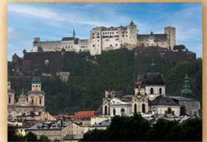
ホーエンザルツブルク城