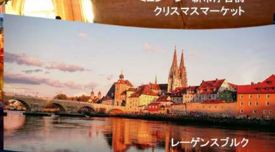
レーゲンスブルク