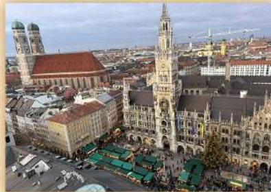
新市庁舎前マリエン広場 クリスマスマーケット (イメージ)