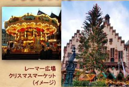
レーマー広場 クリスマスマーケット (イメージ)