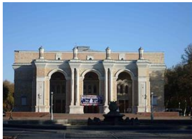
ナヴォイ劇場(タシケント)