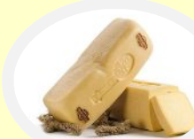
<ラグーサーノチーズ>

華やかに装飾されたバロック様式の家並みが続くラグーサの街。DOP 認定されたこの地方で生産されている「ラグーサーノチーズ」の製造所を見学します。