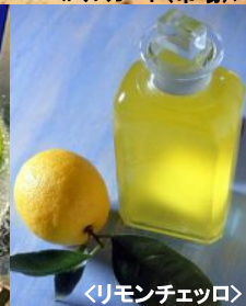
〈リモンチェットロ〉