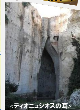
<ディオニシオスの耳>

低い海拔に囲まれた美しい古代都市。ギリシャ時代とローマ時代の遺跡がある「ネアポリ考古学公園」を見学します。