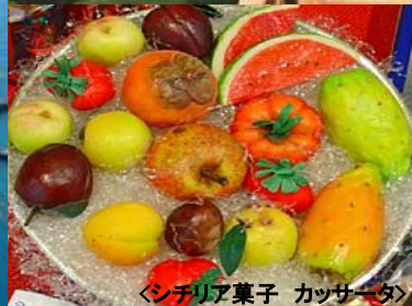
〈シチリア菓子 カッサータ〉