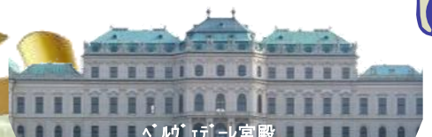
ベルヴェデーレ宮殿