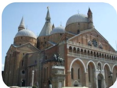
パドヴァのサントニコ聖堂