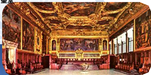
ヴェネチアのドゥカーレ宮殿