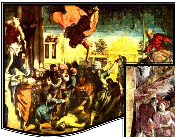
ティントレット 『奴隷を救う聖マルコ』