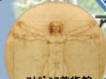
7カメリア美術館所蔵品