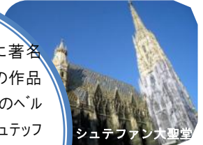
シュテファン大聖堂