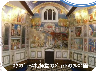
スクロヴェニ礼拝堂のジョットのフレスコ画

ヴェネチア州最古の歴史を持つ芸術都市。聖地と名高いサンタ・アントニオや、ジョットのフレスコ画で知られるスクロヴェニ礼拝堂を訪問します。