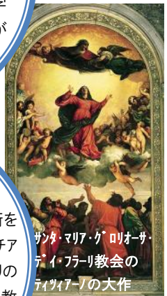
サンタ・マリア・グロリア・サ・デイ・フラーリ教会のティツィアーノの大作