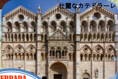
壮麗なカテドラル