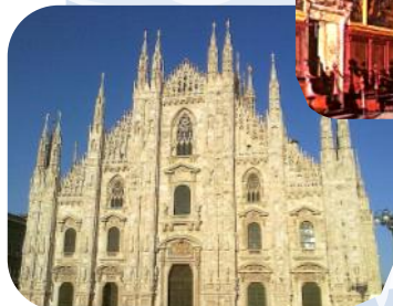
ミラノのドゥオモ

水の都ヴェネチアから、中世の面影が残る3都市を訪問 華やかなミラノを後にし、ウィーンの宮廷文化にふれる… ヨーロッパ美術の真髄を辿り、6都市を巡る盛り沢山の内容です