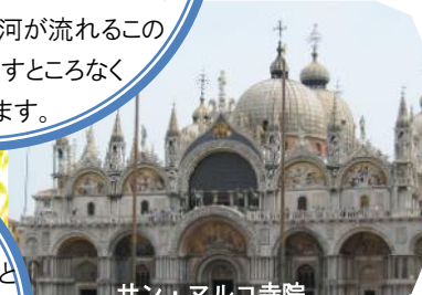
サン・マルコ寺院

今回『美術の旅』の他に2012年3月7日(水)～3月16日(金)10日間『地中海に浮かぶ太陽の島 シチリアの食と文化の旅』を企画しております。料理学校での講義講習、やチーズ製造所、ワイナリー見学に加え、シチリア観光も楽しめる内容なので、こちらのパンフレットもご覧下さい。尚、美術の旅と続けてご参加される方には、特別割引をご用意させていただきます。